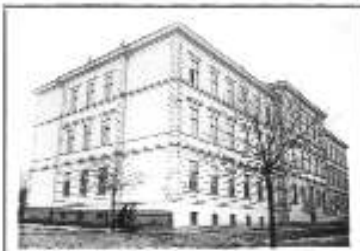
Suceava Liceul ortodox-orient. „Stefan cel Mare” infiintat in 1860 nume de h. h. Obergymnasium