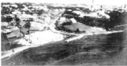
1914-15. din Suceava vedere din Aer