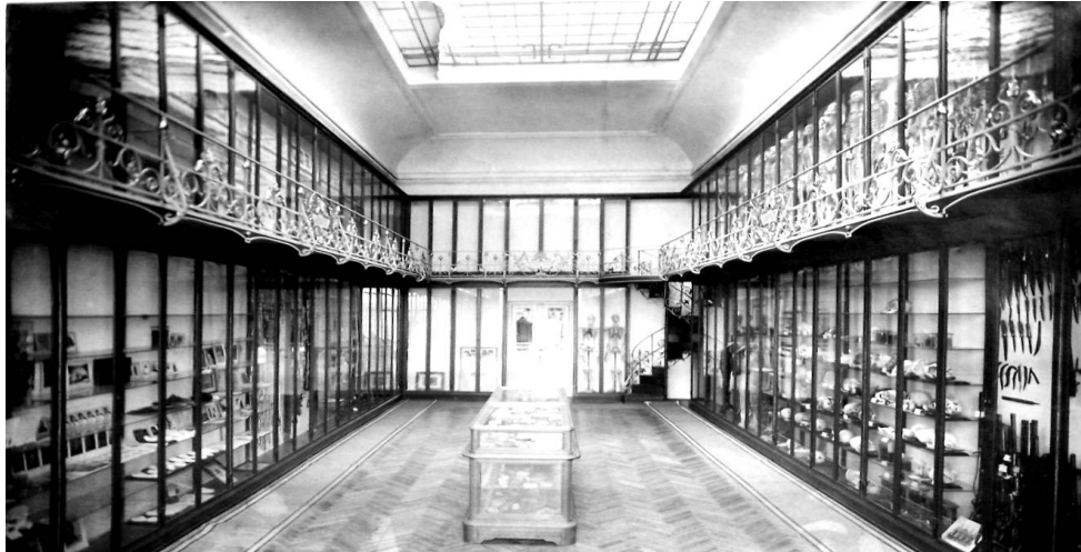
Institutul de Medicina legală Mina minovici

hazard, natura experimenta cele mai hidoase forme de supraviețuire. Copii făceau veritabile slalomuri printre epidemiile periodice de variolă, malarie, scarlatină, pelagră, asta dacă nu se nășteau tuberculoși, sifilitici sau rahitici.