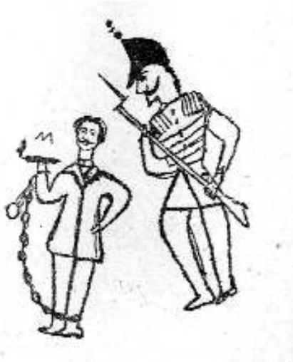
Tatuaj Un deținut spre eșafod

Bucureștiul a fost și încă mai este „o carte de vise” pentru aceea care nu-l cunoaște și nu-i de mirare că aici „orice femeiușcă visează catifea, trăsuri și palate deși nu are ce mânca acasă”, încă din 1842, dacă ar fi să-l cităm pe puritanul Wilkinson. Eleganța