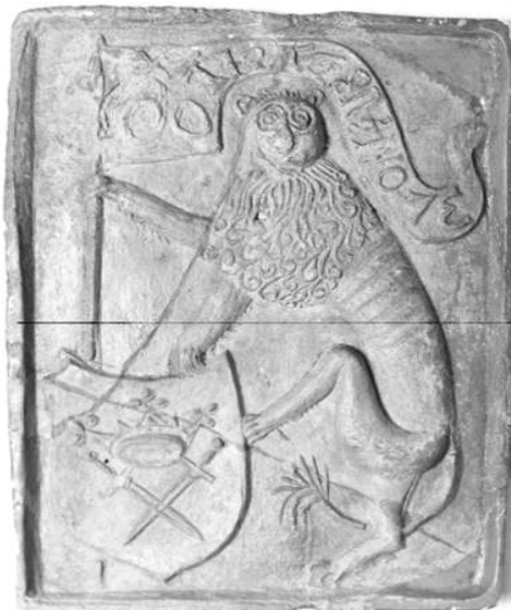
Cahlă, secolul al XV-lea, Sibiu