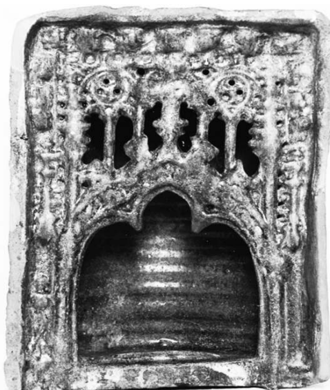
Cahlă olană, secolul al XV-lea, Sibiu

Proveniența cahlei a generat o serie de discuții privind centrul de fabricare, noi considerăm că aceasta a