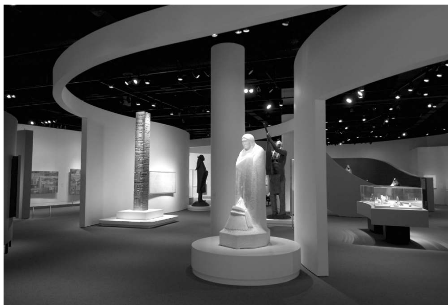
Imagine din galeria Native Modernism

ariilor culturale. De aceea, nu se poate spune că Muzeul Național al Indienilor Americani este o instituție organizată riguros științific. Din el nu pleci chiar îmbogățit și lămurit asupra culturilor tradiționale ci, mai degrabă, asupra culturii contemporaneității. El pare a se adresa aceluia care deja știe, în mare, ce sunt indienii, ce și cum a fost viața și civilizația lor în vechime și vin doar să afle ce mai fac ei astăzi. Gândit ca spațiu de agrement și de recreere, vizitatorul îl părăsește bine dispus, inspirat și interesat de indieni, dorind să afle mai mult despre ei. Iar pentru aceasta este recomandabil a se merge peste drum, la Muzeul Național de Istorie Naturală, pentru a aprofunda subiectul într-o instituție de veche tradiție în cercetarea de specialitate.