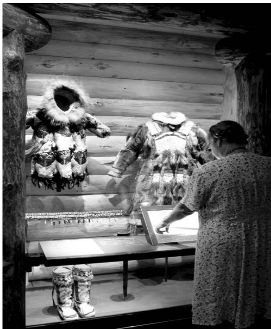
Imagine din expoziția Our Universes

Mexic, Guatemala ori Bolivia, ceea ce dă mostre convingătoare de unitate în diversitate. O vitrină era umplută cu vârfuri de săgeți din silex. O alta cu medaliile de argint bătute de-a lungul timpului, cu efigiile președinților americani spre a fi oferite în dar căpeteniilor indiene; era acolo marea medalie oblongă pe care a purtat-o bravul irochez Red Jacket, conferită lui de președintele George Washington, gravată cu o compoziție în care primul primește pipa păcii oferită de al doilea; apoi erau cele ale lui Thomas Jefferson pe care căpitaniii Lewis și Clark le-au distribuit în timpul explorării lor transcontinentale din 1804-1806, și până la aceea bătută de John Fitzgerald Kennedy la începutul anilor 1960. Pentru a evoca perioada conquistadorilor, o vitrină era plină cu spade spaniole și cu bijuterii din aur masiv, atât de râvnite de acei aventurieri, iar într-alta erau expuse arme de foc, de la puștile cu cremene la cele cu capsă și cele cu repetiție, revolvere Colt și carabine Winchester ori Remington, unele aparținând chiar unor ilustre