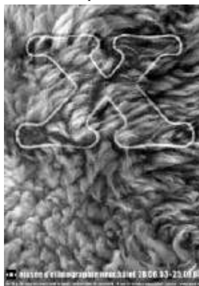
Fig. 3 Afișul expoziției disponibil pe situl instituției, www.men.ch

Etnografia este astăzi confruntată cu problema că este înghițită de artele frumoase. Există o tendință care spune că obiectele etnografice trebuie privite ca și operele artiștilor noștri occidentali. Ori, aceste obiecte erau utilitare, este un aspect care e șters cu buretele, căci nu e mereu simplu de povestit etnografia (...) Nu se poate nega că aceste obiecte au o estetică, dar ele erau utilitare, iar noi, Occidentali, am decretat că erau frumoase”. Nu am reprodus aici decât citate cu privire la doar două din expozițiile șoc, din care, vrând nevrând, vizitatorul rămâne cu o informație pe care o reține exact din cauza diferenței pe care aceasta o reprezintă față de sistemul său obișnuit de valori. Este însă demn de reținut situl instituției, www.men.ch , unde pot fi aflate multe alte detalii cu privire la activitatea