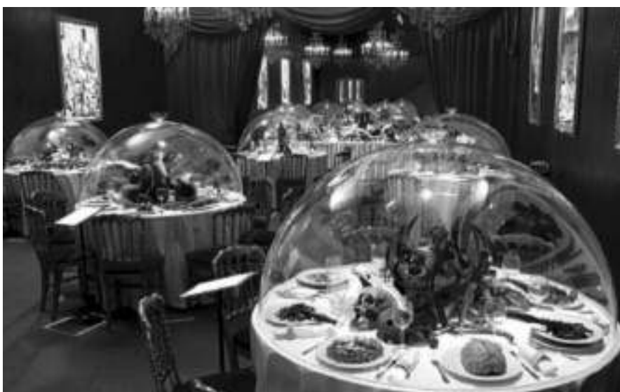
Fig. 2 Imagini din expoziția Le Musée cannibale, disponibilă pe situl instituției, www.men.ch

transformate în vitralii. O modalitate de a aminti că actul în sine al Împărtașaniei funcționează în baza unei simbolistici antropofage”. Discutând cu Bernard