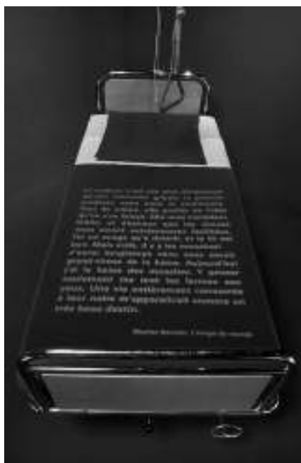
Fig. 5 Așa-zisul salon de spital, în care bolnavii sunt reprezenți de maladiile descrise pe pancarte